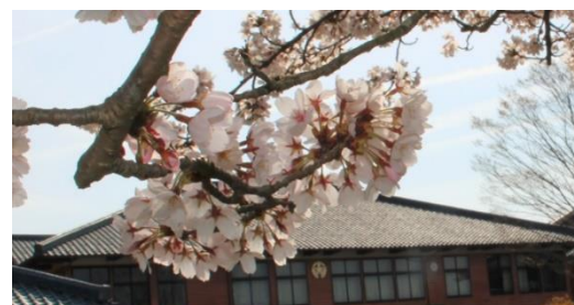
4/11 学校の桜も満開でした。

5月になると、地域運動会開催に向けて、保護者、地域の皆様から多数のご協力をお願いするかと思います。また、様々な校外学習を実施するにあたり、多くの皆様からの見守りや支援が必要となります。地域とともに歩む学校を目指し、皆様のご意見も取り入れながら、今年度の教育活動を展開して参ります。より一層のご支援、ご協力をよろしく願いいたします。